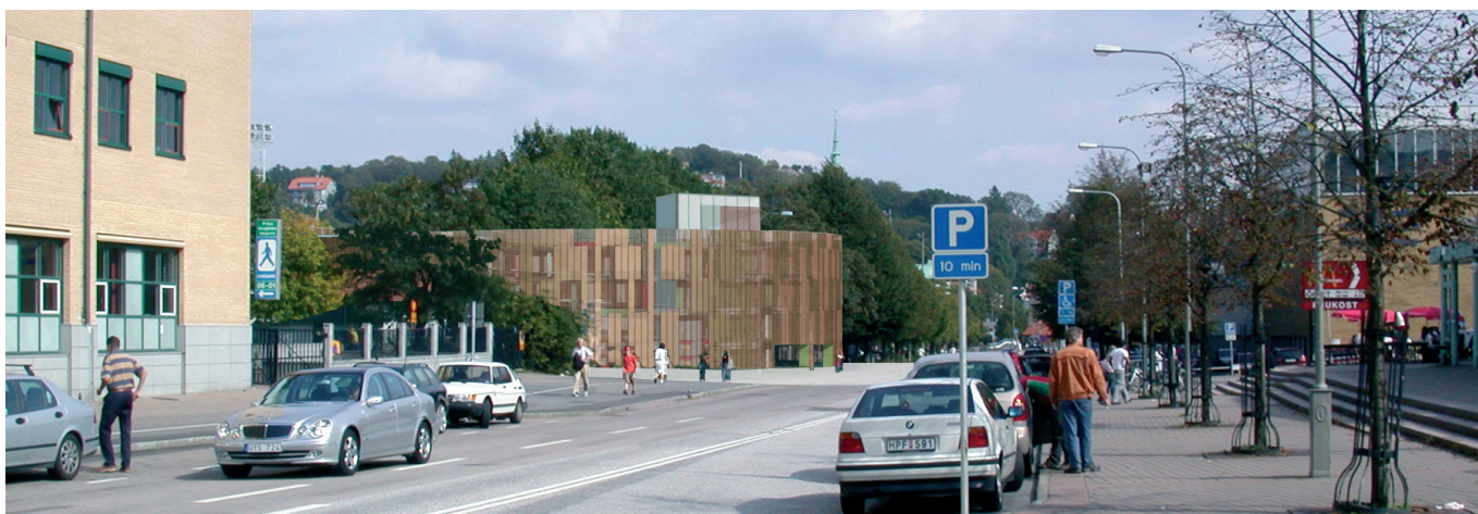
Fotomontage från Valhallagatan

För att möjliggöra parkering av bussar på Evenemangsområdet i Göteborg vill man använda sig av den öppna parkeringsplats som ligger utmed Valhallagatan. Att bygga ett garage åt bussar skulle bli mer tekniskt avancerat än för bilar, så istället samlas bilparkeringen i ett garage och bussarna ställs upp i det fria.