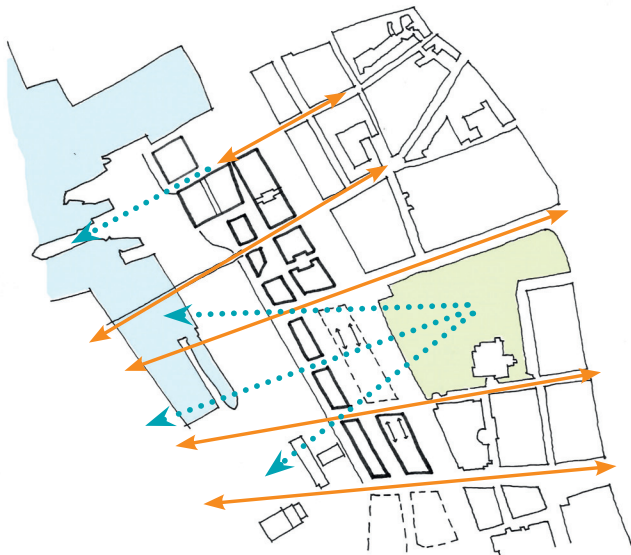
STRÅK OCH SIKTLINJER, FRÅN REKOMMENDATIONER FÖR KNOTPUNKTEN