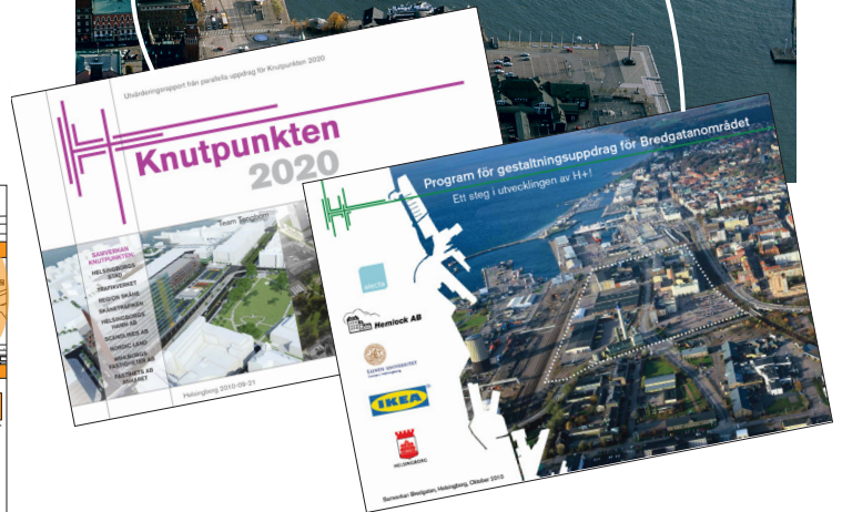
PROGRAM FÖR OCH SUMMERING AV PARALLELLA UPPDRAG

H+ är ett av Sveriges största och mest spännande stadsförnyelseprojekt. Kring och söder om centralstationen i Helsingborg ska stora hamn- och industriområden utvecklas till en central attraktiv blandstad.