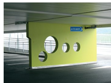
Våningsplanen är färgsatta i olika kulörer, en för varje våning, vilket underlättar orienterbarheten