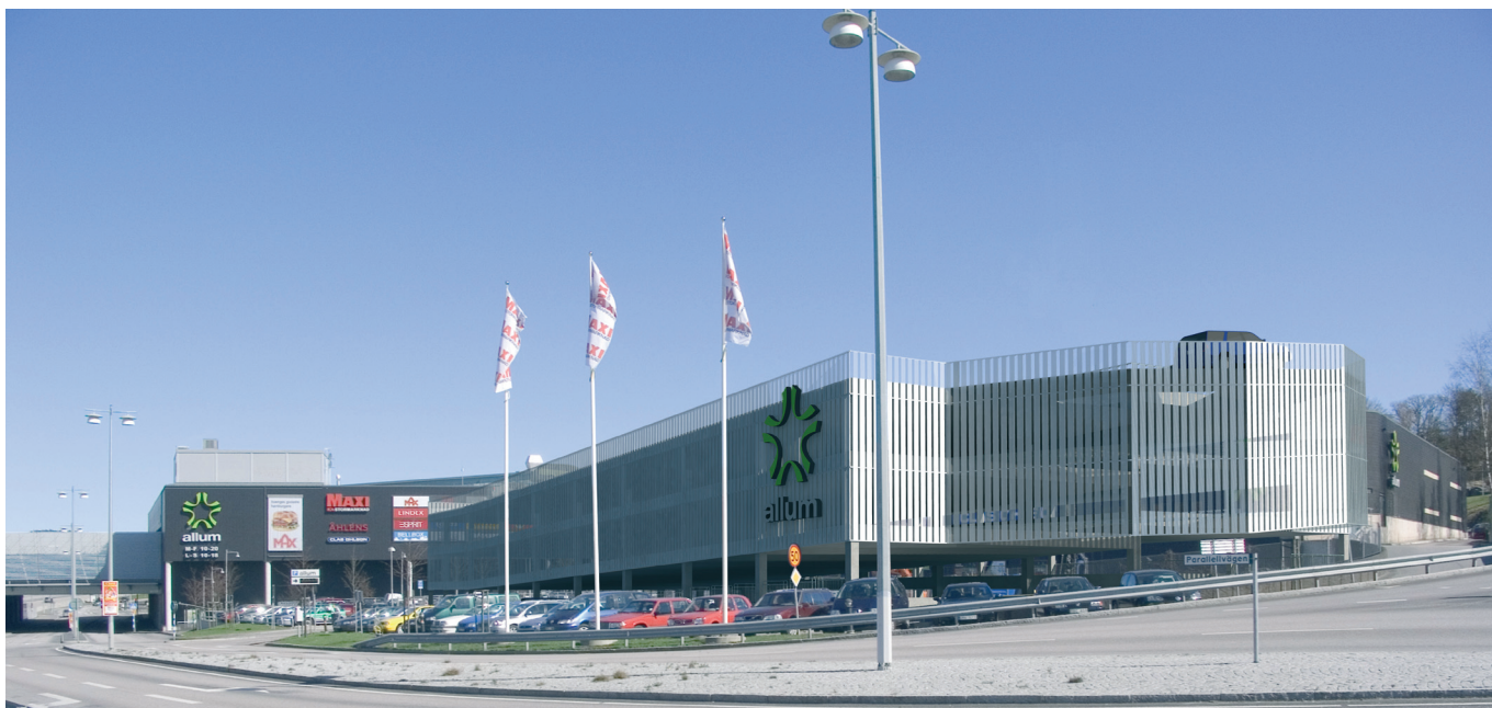
Vy från nordväst

Det nya köpcentret Allums behov av parkeringsplatser visade sig vara större än förväntat, därför har nu ett nytt parkeringshus vid ICA söder om E20 byggts. Huset bildar en länk mellan de befintliga parkeringarna på taket respektive markparkeringen väster om entrén till Allum/ICA och det går att köra och söka platser genom hela anläggningen. Även ett nytt p-däck med 86 platser söder om den befintliga takparkeringen har uppförts. Parkeringshuset är byggt med en stomme av prefab betong, håldäck på pelarstomme. Fasaden består av glasplank monterade med ett mellanrum mellan varje plank för ventilationen skull. Husets baksida, fasaden mot ICA är helt öppen. Därigenom uppnås att hela husets ventileras naturligt.