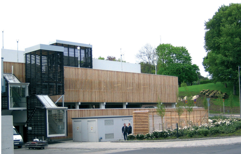
Vy från kyrkan