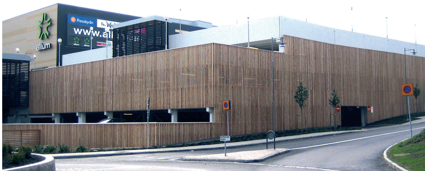
Vy från Gamla Kronvägen

I Partille har det befintliga parkeringshuset i centrum kompletterats med två nya våningsplan och fått en ny fasad i lärkträ. De stående träribborna släpper in ljus i huset samtidigt som fasaden utifrån ger ett lungt och enhetligt intryck. Trapphusen, befintliga och nya, är även de klädda med trä. Här är de glest liggande ribborna svartmålade.