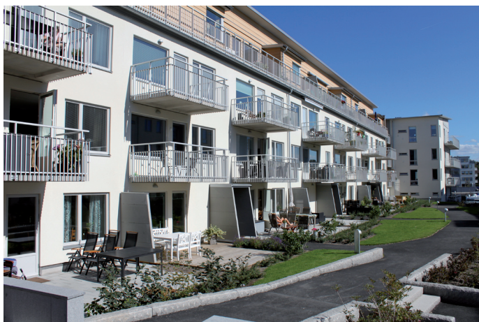
Gårdsmiljö med balkonger och uteplatser mot söder

Byggnaderna i norr och söder har alla balkonger, terrasser och uteplatser åt söder. I huset utmed Sannegårdsgatan har lägenheterna två balkonger, en åt gården i öster och en i väster. Fasaderna är i vit puts enligt gestaltungsprogrammet. Skivor i grått och gult klär fasaderna på terrassvåning.