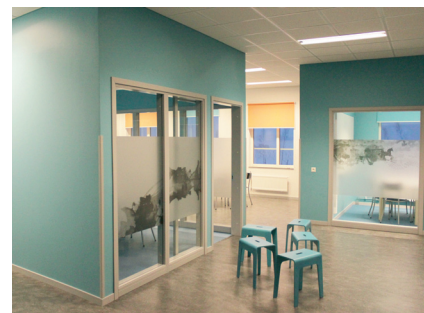
Grupprum/arbetslagsenhet turkos - hästen

Vreta Naturbruksgymnasium i Östergötland genomgår just nu stora förändringar. 2006 togs beslut att bygga ut skolbyggnaden. Istället för att bygga om på plats, bestämdes det att man skulle flytta hela verksamheten några mil västerut och bygga helt nytt. Dels för att nuvarande tomt hade begränsningar och dels för att skolbyggnaden för teoretiska undervisningslokaler låg så långt från de praktiska ämnena. Flyttade man skolan närmare det befintliga häststallet, hagen och skogen sparade eleverna mycket tid som de idag använder på transport i bussar fram och tillbaka mellan de olika lektionerna.