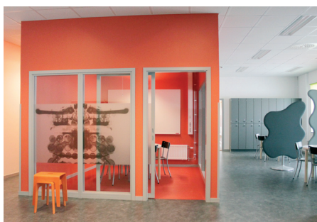
Grupprum/arbetslagsenhet orange - lantbruk