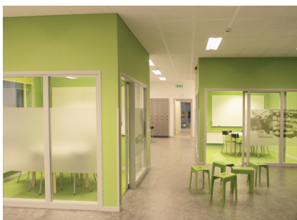
Grupprum/arbetslagsenhet limegrön - skogen