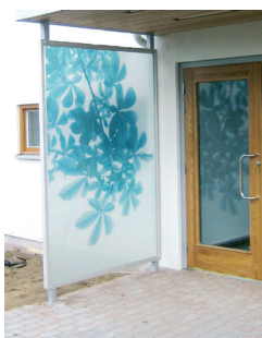
Glasskärm med konstnärlig utsmyckning välkomnar i entréen