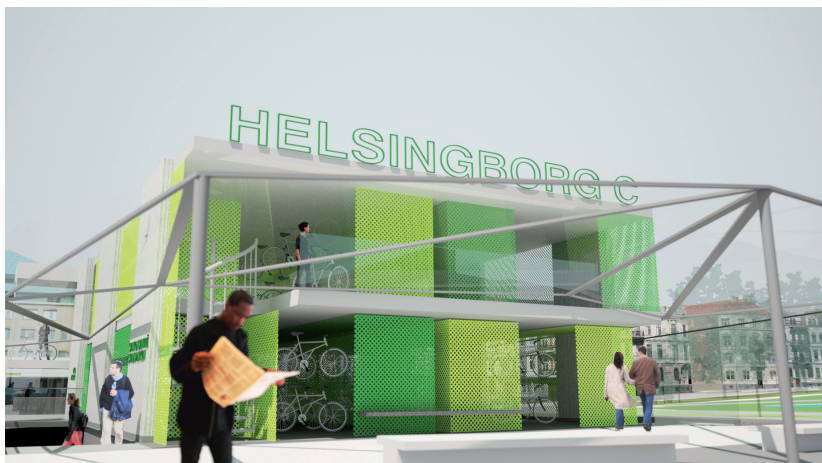
Passagen vid stationsentrén

Mellan trapporna byggs ett cykelparkeringshus i två våningar. Norr om detta placeras en cykelparkering utan tak. Totalt ger detta platser för ca 600 cyklar. Cykelhuset hjälper till att annonsera stationsentrén och kan fungera som en symbol för miljövänligt resande. Fasaderna består av vertikala täta skivor och sträckmetall i olika gröna nyanser. Huset byggs i moduler, lätt flyttbara med större lastbil. Den gröna inramningen av cykelparkeringen samspelar med stadsparkens grönska. Det enkla oktagonala formspråket ger en lugn bas till det asymmetriskt formade taket som välkomnar resenären.