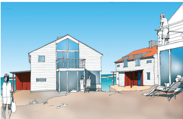
Miljöbild mellan parhusen