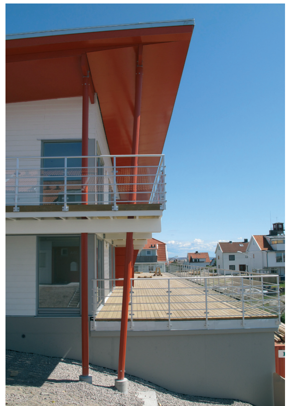
Flerbostadshusets terrass och balkonger

Högst upp på Smögenön med en fantastisk utsikt över havet låg fram till branden 1998 den anrika badrestaurangen Smögenbaden. På denna tomt har vi ritat 24 lägenheter med bostadsrätt. En avgörande ambitionen har, vid sidan av att skapa goda och intressanta bostäder, varit att ta tillvara den fantastiska utsikten. Åtta av lägenheterna ligger i ett flerbostadshus inspirerat av det gamla Smögenbaden och andra badhotell i kustbandet men med ett modernare uttryck. Övriga 16 lägenheter finns i parhus inspirerade av den bohuslänska byggnadstraditionen i allmänhet och fyrvaktarebostäder och andra mer avskalade byggnader i det yttre kustbandet i synnerhet. Samtliga hus, har med tanke på klimatet och det utsatta läget, klätts med fibercementplattor på klink. Fasaderna har även mindre inslag av trä.