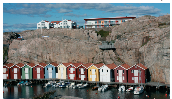
Smögenbaden med hamnens sjöbodar vid bergsts fot.