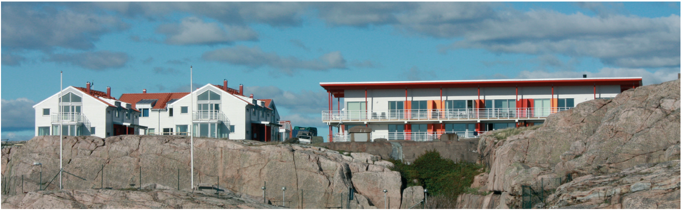
Parhusen och flerbostadshuset syns på bergsts krön..

Högst upp på Smögenön med en fantastisk utsikt över havet låg fram till branden 1998 den anrika badrestaurangen Smögenbaden. På denna tomt har vi ritat 24 lägenheter med bostadsrätt. En avgörande ambitionen har, vid sidan av att skapa goda och intressanta bostäder, varit att ta tillvara den fantastiska utsikten. Åtta av lägenheterna ligger i ett flerbostadshus inspirerat av det gamla Smögenbaden och andra badhotell i kustbandet men med ett modernare uttryck. Övriga 16 lägenheter finns i parhus inspirerade av den bohuslänska byggnadstraditionen i allmänhet och fyrvaktarebostäder och andra mer avskalade byggnader i det yttre kustbandet i synnerhet. Samtliga hus, har med tanke på klimatet och det utsatta läget, klätts med fibercementplattor på klink. Fasaderna har även mindre inslag av trä.