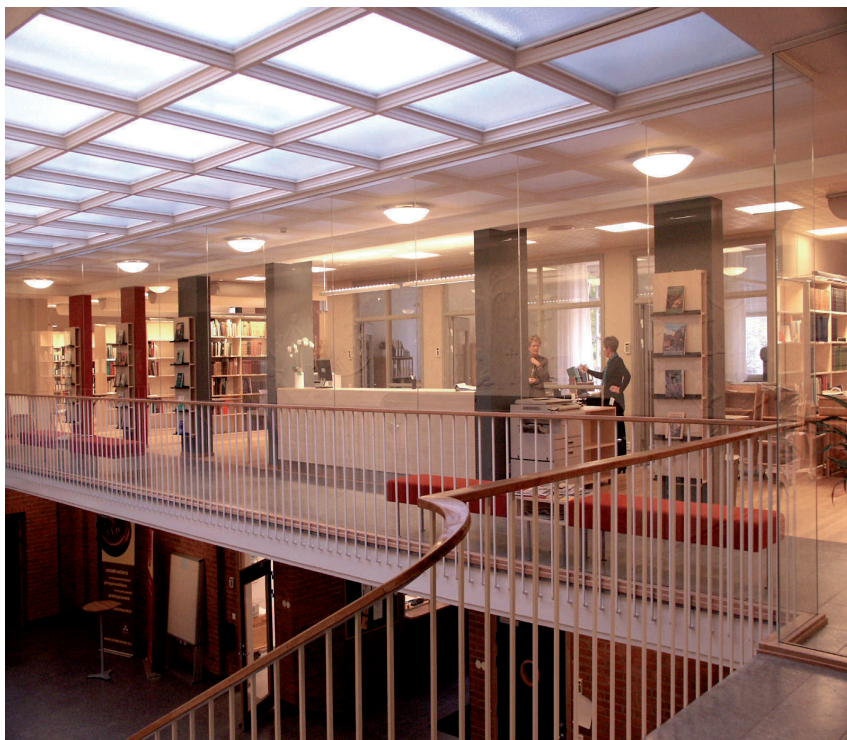
Entréhallen med biblioteket