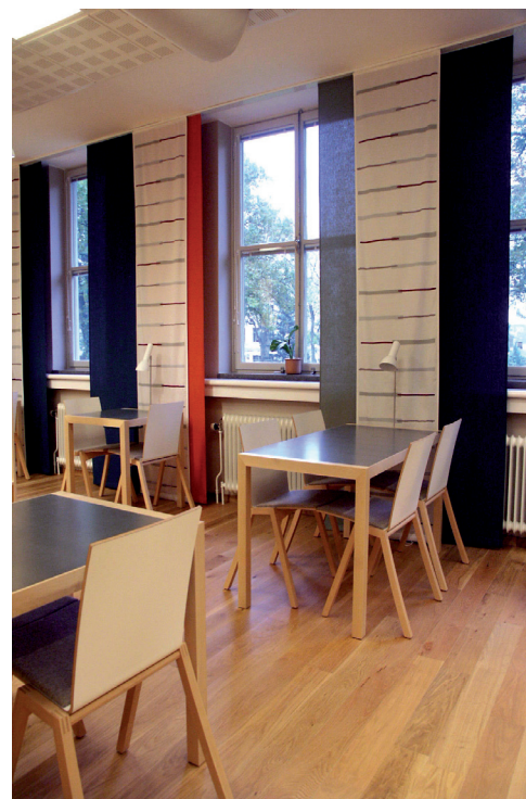
Studieplatser i biblioteket

Sveriges Lantbruksuniversitet (SLU) i Skara har genomfört en omfattande utvidgning och omdisposition. Huvudinslaget i denna har varit ombyggnaden av universitetsområdets huvudbyggnad till ett ELEVERNAS HUS.