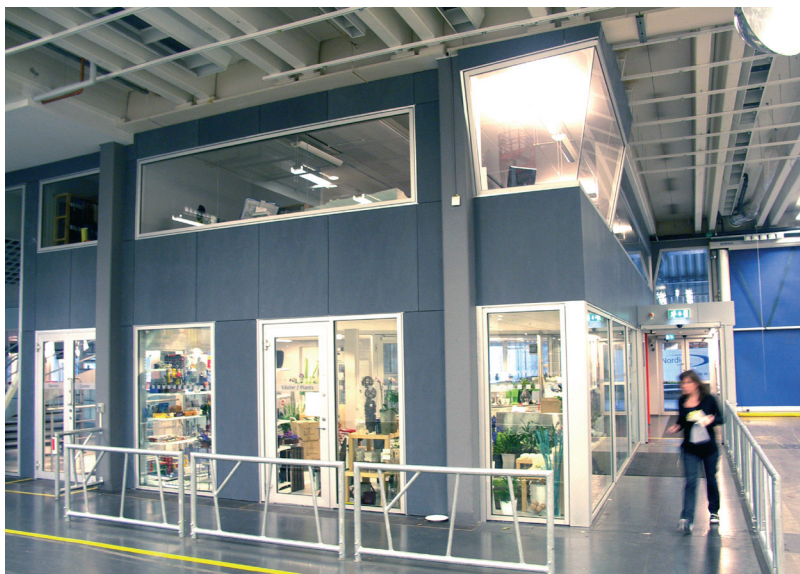
Servicecenter från mässhallarna - växtservice i hörnet