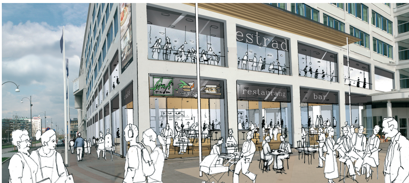
Vision: hörn mot Korsvägen

Sedan början av 1990-talet har ABAKO haft Svenska Mässan Stiftelses (SMS) förtroende att få arbeta med dess mångfacetterade hotell-, konferens- och mässanläggning i det sk "evenemangsstråket" i Göteborg. Efter vunnet parallellt uppdrag utförde ABAKO under 90-talet projektering av A-hallen vilken avslutar kvarteret mot Mölndalsån.