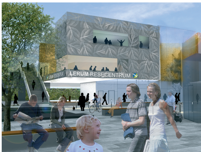
Som tunna skira löv klär fasadskivan i metall in byggnaden