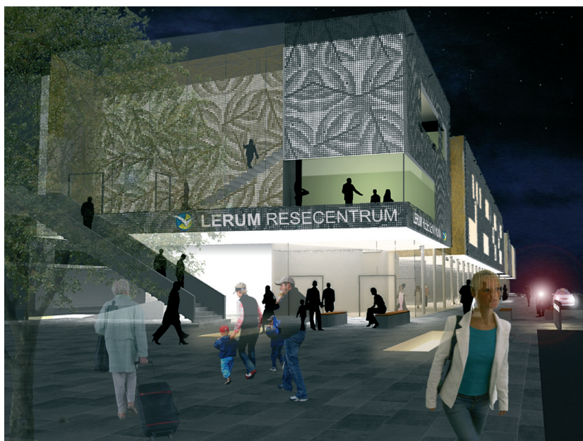
Resentrumets fasad lyser under kvällen

Förslaget resulterade i en långsträckt och strikt byggnadsvolym i tre våningar med en dockningsterminal i bottenvåningen och kontor/konferens/gym i de övre våningsplanen. Ett större parkeringsdäck med 400 p-platser för pendelparkering rymdes i källarplanet. Vår ambition var att skapa en byggnad där resenärerna är i fokus och där bytena mellan olika trafikslag sker med korta avstånd. Byggnaden skulle också annonsera Lerum mot motorvägen och samtidigt fungera i närmiljön. Vi valde att klä in byggnaden i tunna metallplåtar med ett instansat mönster i form av lövverk. På kvällen belyser man fasaden inifrån för att få ett varierat fasadtryck och skapa en ljus och trygg miljö för resenären även kvällstid.