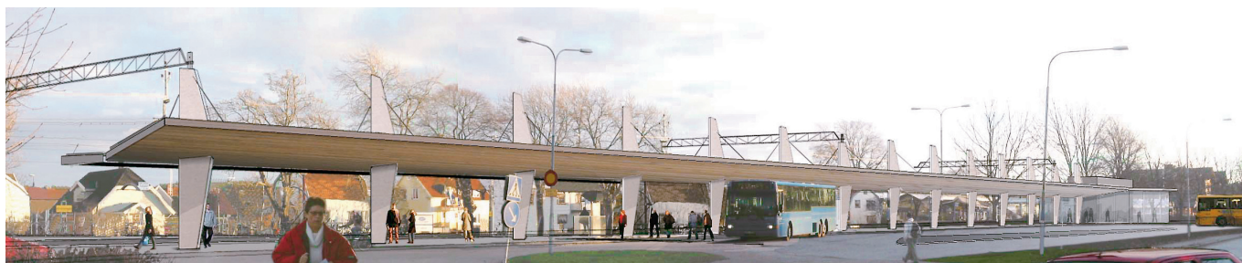
Skärmtak sett från norr