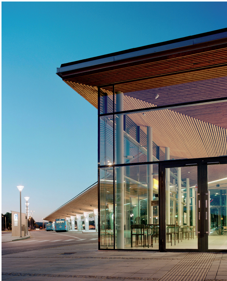
Uppglasningen av byggnaden ger god kontakt med bussangöringen

I projektet ingår ny lösning för busstrafiken samt utformning av markbeläggningar, väderskydd och informationssystem.