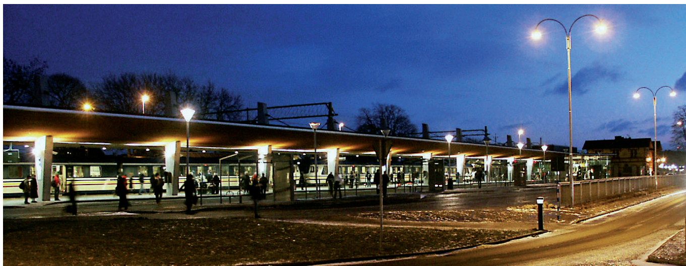
Kungälv resecentrum från nordväst

När mörkret sänker sig skall ljuset i Kungälv resecentrum leda resenärerna rätt och markera den över 150 meter långa anläggningen i stadsbilden. Vi har strävat efter att använda ljuset som material i byggnaden och inredningen. Ljuset skall även markera platser och punkter av betydelse liksom förstärka de ingående materialens karaktärer.