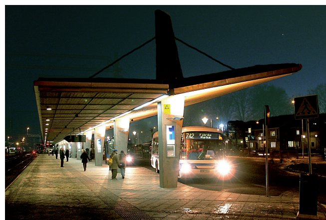
Skärmtaketets norra gavel

I Kungälv resecentrum har informatiken vävts samman med arkitekturen och ljussättningen. Hållplatslägena markeras tydligt med infällda självlysande skyltfronter i skärmtaketets pelare och väderskyddens väggskivor av betong. Hållplatsernas bokstäver har speciellt formgiven grafik. Det stora uppvecklade skärmtaket belyses underifrån. Ytterligare ljus kommer från den långa lysrörsslitsen som löper i taket utmed hela anläggningens längd.