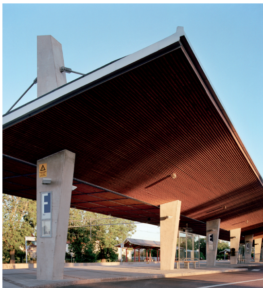
Det uppvecklade skärmtaket med solbelyst undersida

Invid Kungsbacka station invigdes 2003 ett nytt modernt resecentra. Förhållnings sättet är att med få skulpturalt sammanfogade delar i en anspråkslös höjdskala skapa en anläggning, som accentuerar den K-märkta stationsbyggnaden samtidigt som resecentrat görs mycket tydligt.