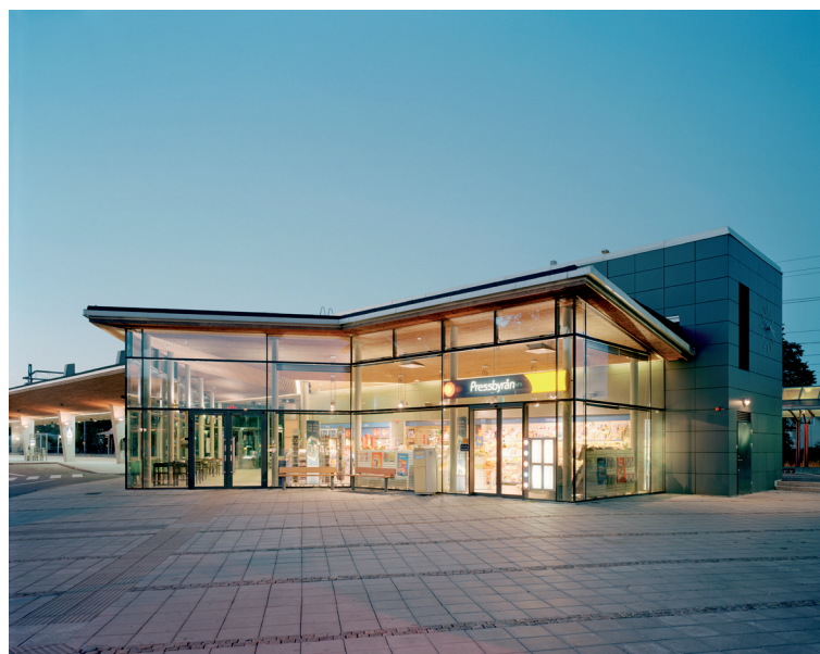
Butiks- och väntdelen framför byggnadsblocket