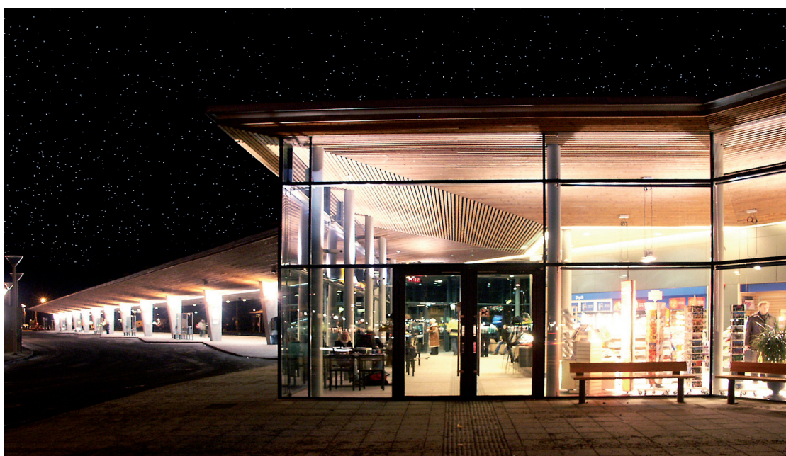
Huvudentrén mot Kungälv centrum