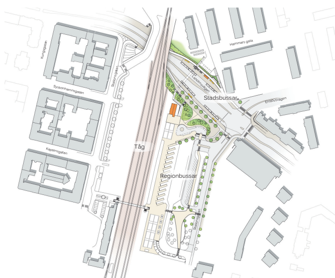
Etapp 2 2015 (skiss 2012)