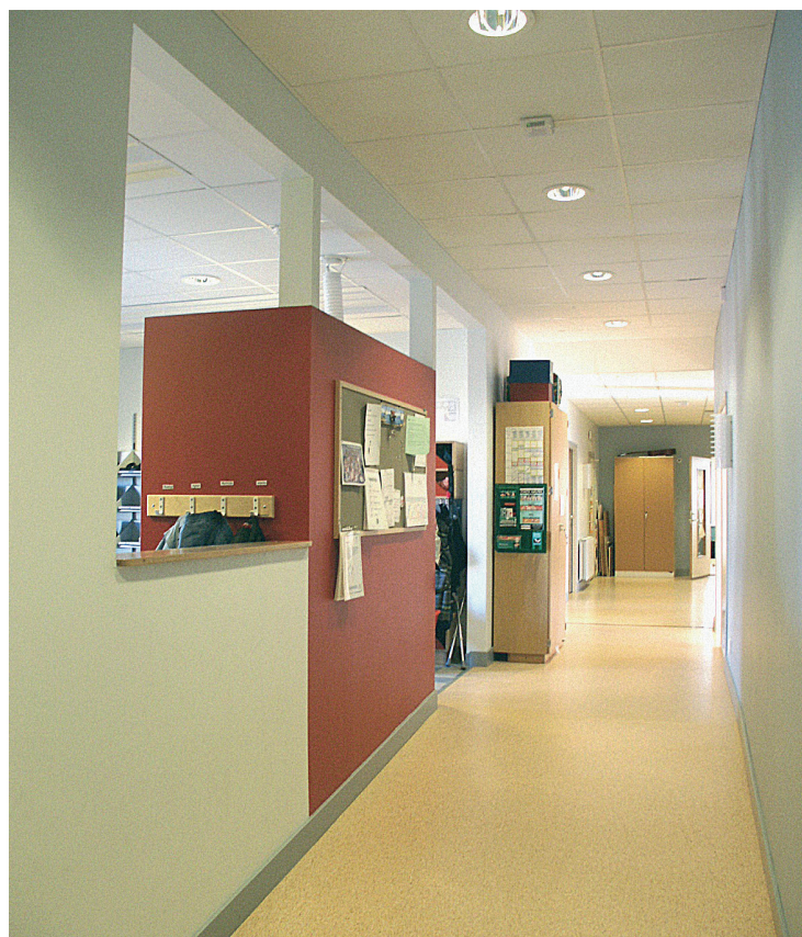
Stråk genom tillbyggnaden för de yngre barnen