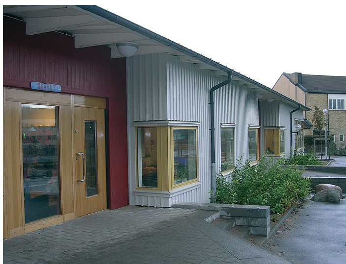
Nybyggnadens entréer har markerats med mörkröd stående panel

Även de befintliga skollokalerna har anpassats till de äldre elevernas arbetssätt med storklasser om ca 50 elever. Huvudentrén har också förnyats med glaspartier i ek som skapar öppenhet och kontakt mellan det nya elevcaféet och skolans bibliotek.