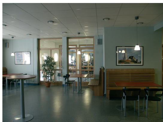
På bägge sidor om det centrala trapphuset har nya glaspartier i ek fått skapa öppenhet och genomsikt mellan det nya elevcaféet och biblioteket.