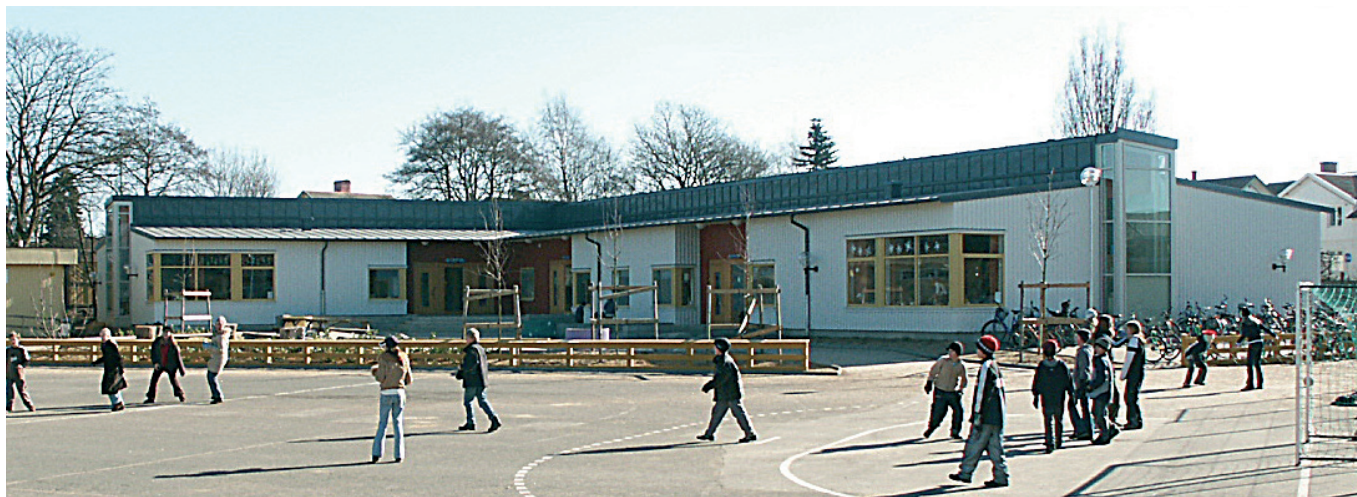
Ny tillbyggnad för de yngre barnen

Mitt i centrala Varberg ligger Hagaskolan, en F-9-skola, som byggts om och till för att möta behoven hos ett ökande antal elever. De yngsta barnen har fått flytta in i en helt ny skolbyggnad. Entréer och allrum vetter mot den gemensamma skolgården, som i samband med nybyggnaden fick en upprustning. Klassrummen i söder och öster har egna uteplatser för undervisning och lek. Nybyggnaden är i trä, ljukt målad med tydligt markerade entréer i rött. Högre lanterniner i gavlarna ger allrummen ljus och rymd.