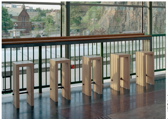
Specialritad barpall i vänthallens övre plan

I Borås resecentrums nya vänthall har man bra överblick genom stora glaspartier. "Vågbänkarna", utplacerade på bägge plan, har en stram profil och associerar till mjuk, vågad Boråstextil. Både en form för ögat och väntandets sociala samvaro. På övre plan, i anslutning till kioskbutik, finns bar-pallar och ståbord. Här kan man ta sin kaffe i cafémiljö.