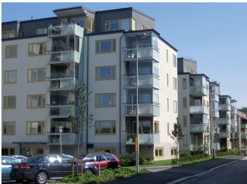
Vy mot Elfhögsgatan

Det centralt belägna kvarteret Angantyr i Trollhättan har bebyggt med bostäder i punkthus i parkliknande gårdsmiljö. Tre fyrvåningshus + indragen takvåning ansluter till omgivande bebyggelses höjdskala och vänder smäckra gavlar mot angöringsgatan. Ett högre hus, 8 våningar + indragen takvåning, är förlagt vid en platsbildning med besöksparkering med utsikt mot parkmiljön kring Trollhätte kanal.