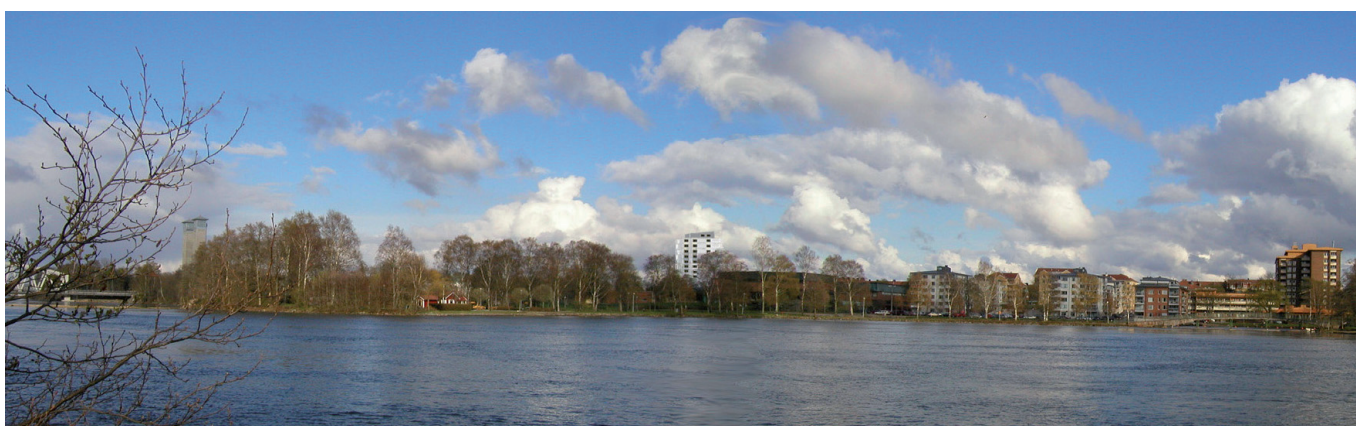
Vy från Göta älv