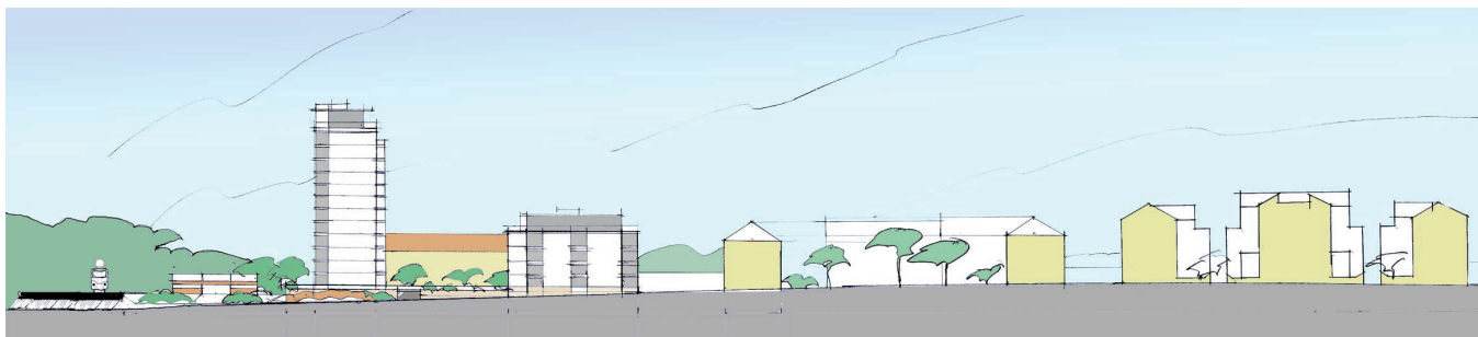
Vy mot Storgatan

Det centralt belägna kvarteret Angantyr i Trollhättan planeras för bostäder i en punkthusbebyggelse i parkliknande gårdsmiljö. Fyra hus i 4 våningar + en indragen takvåning ansluter till omgivande bebyggelses höjdskala och vänder smäckra gavlar mot angöringsgatan.