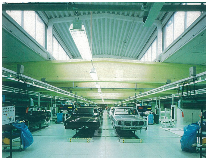
Projekt TBUB: Arbetsstationer med ny lanternin

I en stor fabriksombyggnad för Volvos nya produktionsplattform P2X under senare delen av 1990-talet medverkade ABAKO med projektsekreterartjänster såsom budgetsammanställningar inkl anläggningskort, anläggningstidplaner, stegplaner och layout- och illustrationsarbeten.