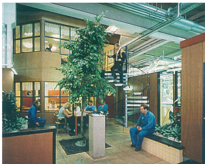
Projekt KBS: "Tvåvåningsradhus med trädgård"