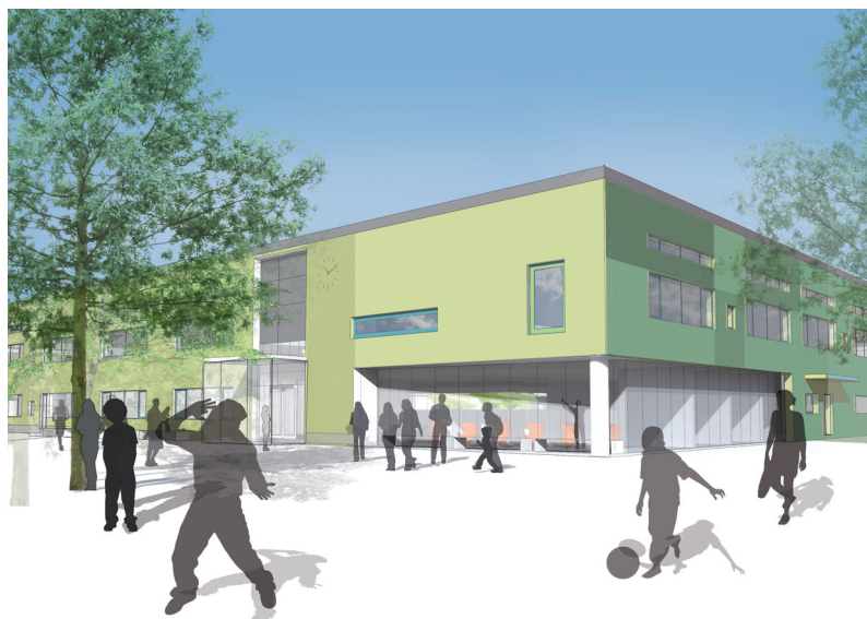
Vy mot huvudentrén

Att bygga för god energieffektivitet är en självklarhet och vi tror att en enkel planlösning ger bra förutsättningar för detta. De olika väderstrecken föreslås få olika fasadkulörer, skivor eller målad betong. Sedumtak är föreslaget på det inre stråkets lägre volym.