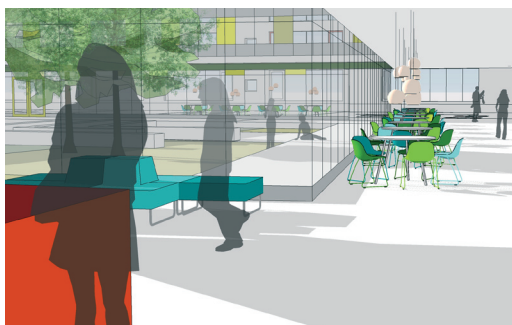
Stråket längs innergården

Från huvudentrén och biblioteket, som är det första man möter när man kommer till skolan, leds man längs innergården via matsal och café till skolans kreativa lokaler som är samlade i norr.