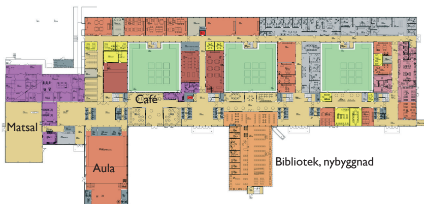
Plan 1, Hus I (ej skala)

I etapp 2 ingår även en ombyggnad av två intilliggande hus vilka inrymmer hotell- och restaurangutbildningen samt gymnasieskolans individuella program. Inom projektet utförs också en översyn av angränsningen med buss och bil till skolområdet och förslag till ny markplanering.