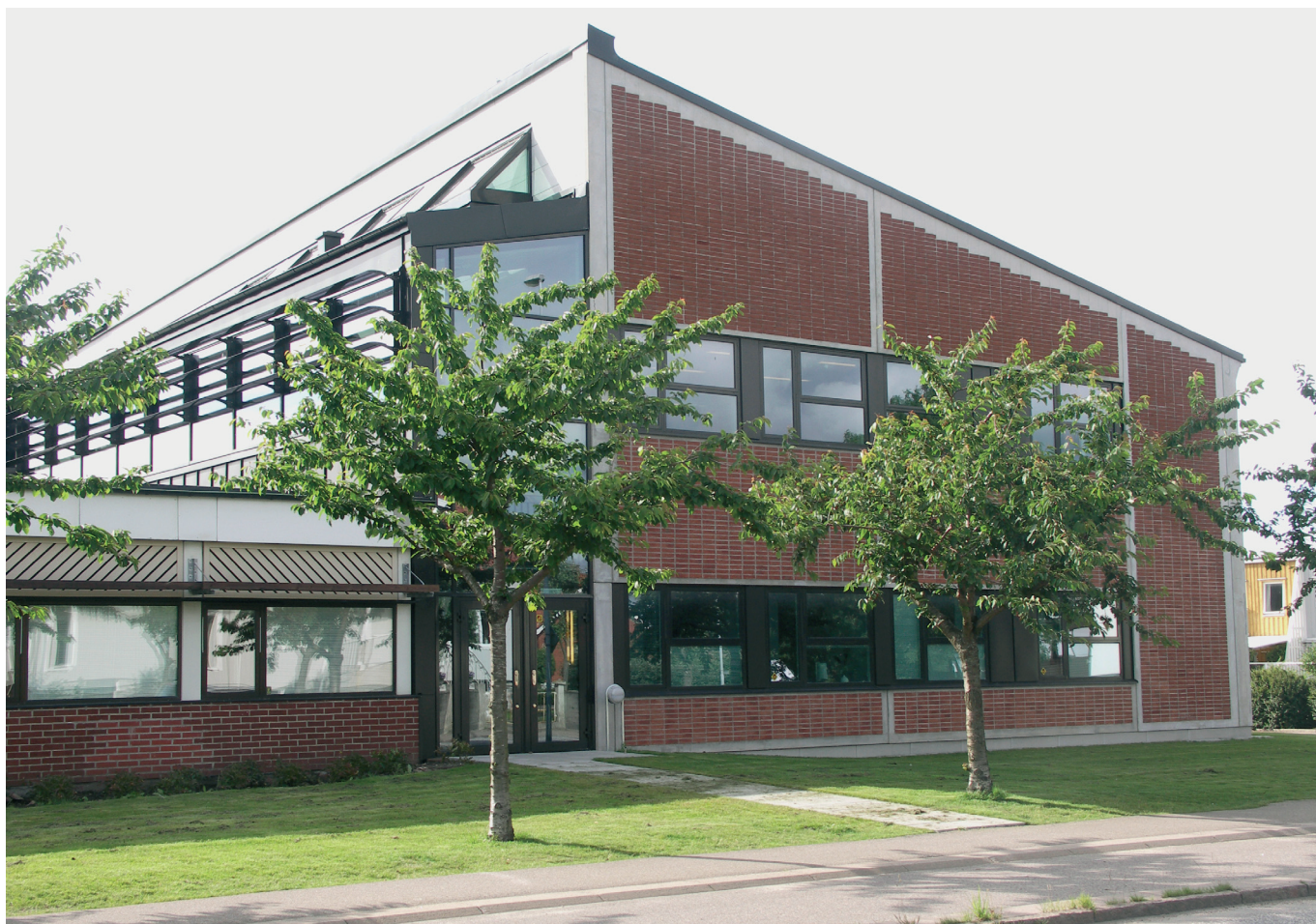
Nybyggnad i två plan och överglasat stråk/anslutning mot befintliga byggnader

Peder Skrivares skola byggdes för drygt trettio år sedan för att ge plats åt en expanderande gymnasieskola och för att erbjuda lokaler som var anpassade till tidens pedagogik. En om- och tillbyggnad har genomförts av samma anledningar. Skolans elevantal har ökat och ett behov uppstod av ett utbud av olika lokaler för varierande undervisningssituationer. Skolan har delats upp i tre självständiga sektorer med vardera ca 600 elever.