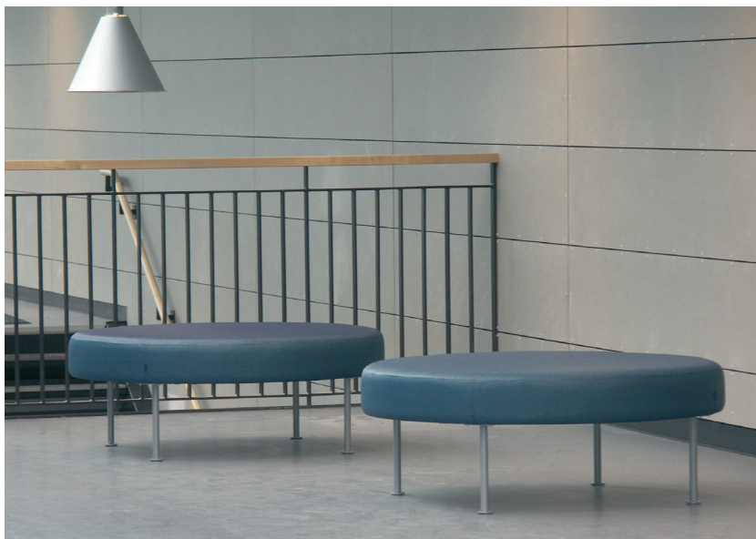
Balkong med sittplatser

Nybyggnaden, hus 9, har fått karaktären av industrimiljö. Här ligger de tekniska programmen tillsammans med naturvetenskapliga ämnen. Den lite tuffare karaktären avspeglar sig även i valet av möbler och starka kulörer på textilierna.