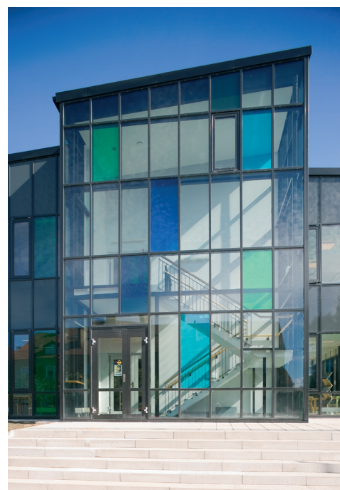
Det nya bibliotekets gavelfasad