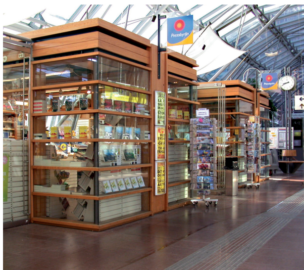
Butiker utmed huvudstråket