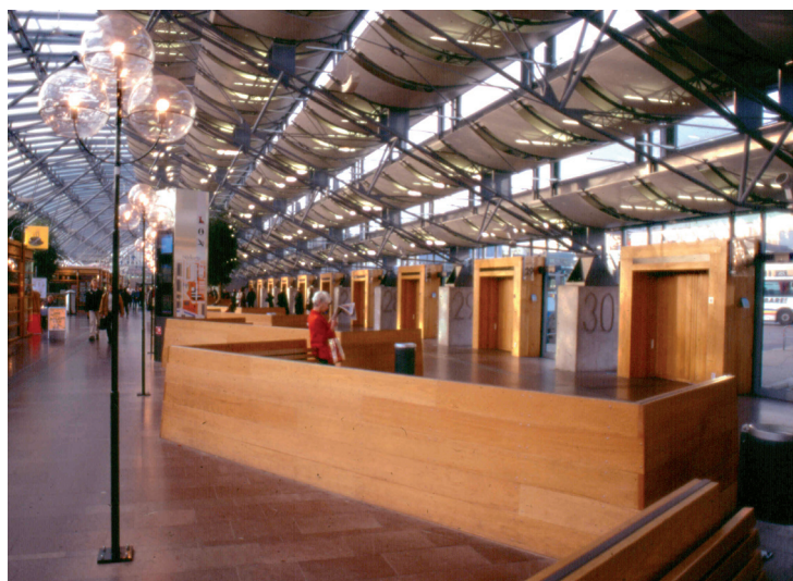
Väntplatser och gater

ABAKO fick 1995 uppdraget att bistå Niels Torp AS i arbetet med den nya regionbussterminalen i Göteborg. ABAKO:s roll i projektet var ett direkt resultat av de bägge kontorens samarbete i det vinnande förslaget i markanvisningstävlingen om ett nytt resecentrum i Göteborg 1991.