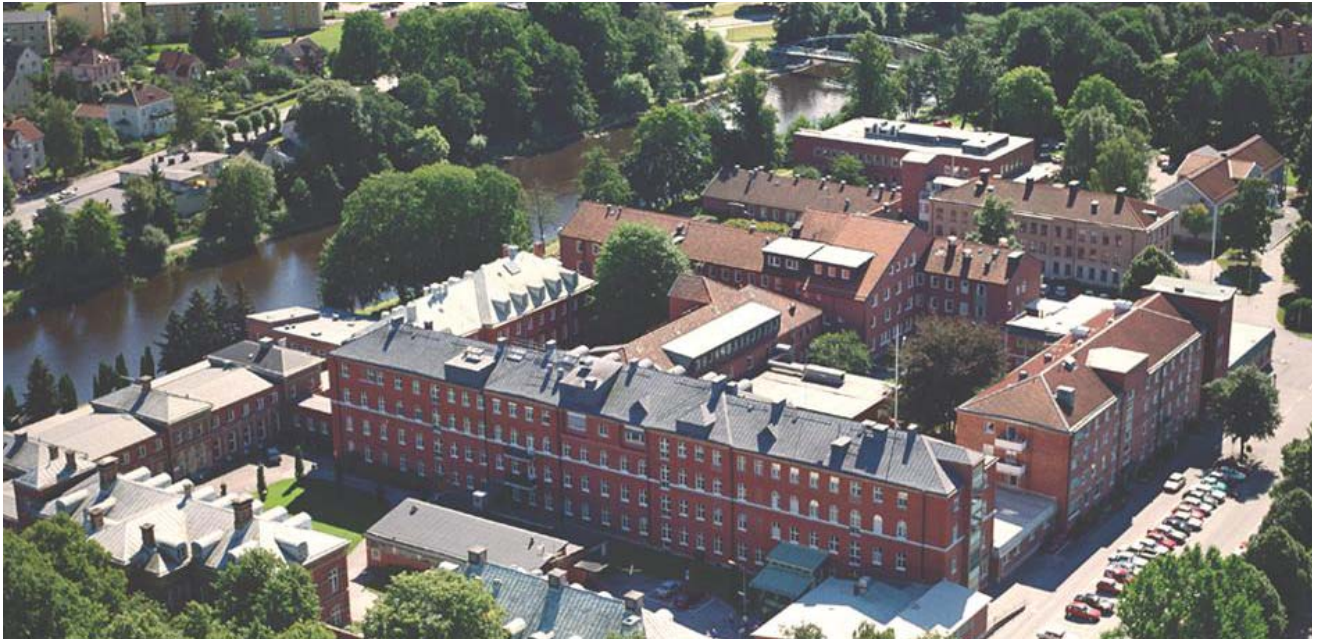
FLYGFOTO FRÅN NORR

Sedan 2003 har ABAKO arbetat med sjukhusplanen för Lidköpings sjukhus. Sjukhusets fastighetsbestånd har en stomme från 1880- och 1920-talet, som därefter successivt har kompletterats till en oklar och svårorienterad struktur med en stor mängd entréer. Innan uppdraget påbörjades var tanken