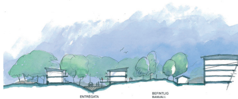
Husplaner och sektion