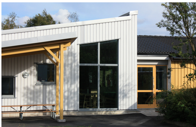
FASAD MOT NORDVÄST OCH DEN GEMENSAMMA GÅRDEN

skapar en egen, inbjudande karaktär. Allrummen, dvs det större, samlade rummet för måltider och lek, har fått hög rumsvolym som följer yttertaket's lutning. Det gula träet från befintlig byggnad återkommer i tillbyggnadens detaljer, medan övrig fasad fått ett ytskikt av ljus grå slätspont.