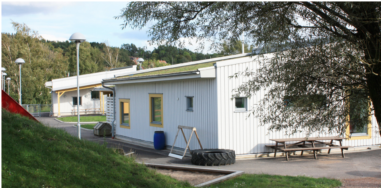
DE TVÅ NYA HUSKROPPARNA RAMAR IN GÅRDEN I NORR

I Kungälv's kommun byggdes under tidigt 70-tal ett flertal förskolor med liknande planlösning. Förskolorna var alla i ett plan med god markkontakt, generösa lekhallar och en mångfald av olika rum. Successivt har efterfrågan på fler förskoleplatser lett till förtätning i befintliga byggnader, samt ibland komplettering med fristående paviljonger.