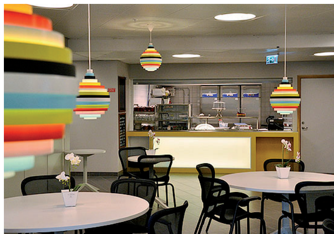
matsal och café i entré