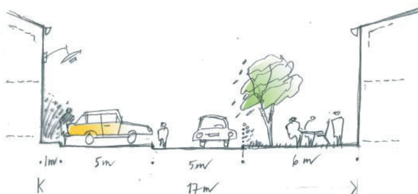
Studie av gatumått. Att kunna parkera bilen nära den egna entrén är en efterfrågad kvalitet.

Vi tror att det är viktigt att de centrumfunktioner som det finns underlag för placeras nära varandra. Gärna kring ett mindre torg som är trivsamt att vistas på och samtidigt lätt att nå. Torget ligger utmed det trygga stråket som löper genom området. Här finns utrymme för olika trafikslag; bussar, bilar, cyklar och gående. Med ca 5 000 invånare i Grundviken kommer det att finnas underlag för en grundskola. Kanske kan även denna placeras utefter det centrala stråket och varför inte bredvid torget? Även ett äldreboende skulle med fördel lokaliseras här. Lokaler kan samutnyttjas och möten mellan generationer uppstår.