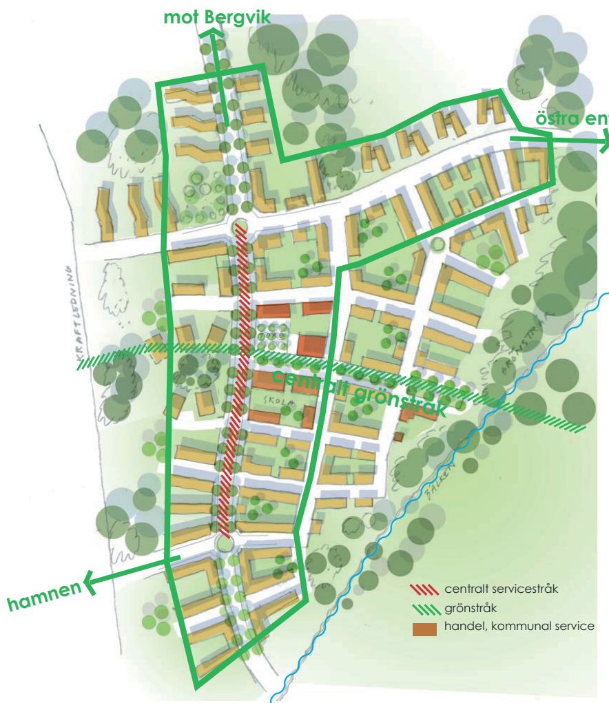
Förslag till utformning av den centrala, stadsmässiga delen av Grundviken. Verksamheterna koncentreras kring ett centralt stråk.

Under våren 2010 har vi arbetat med ett förslag till utbyggnad av Grundviken, en helt ny, vattennära stadsdel strax väster om Karlstads centrum. I nära samverkan med vår uppdragsgivare, PEAB Karlstad, har vi tagit fram skisser och diskussionsunderlag för hur området på ett attraktivt och resursmässigt hållbart sätt kan bebyggas med ca 1700 bostäder. Våra skisser har sedan utgjort underlag för en process där Karlstad kommun i samarbete med olika entreprenörer tar fram riktlinjer för områdets utbyggnad.