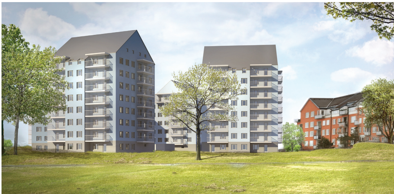
VY FRÅN SYDOST

Elins gård är vackert beläget mot ett stort grönområde i Högsbo höjd. Projektet omfattar fyra punkthus i sex till åtta våningar med totalt