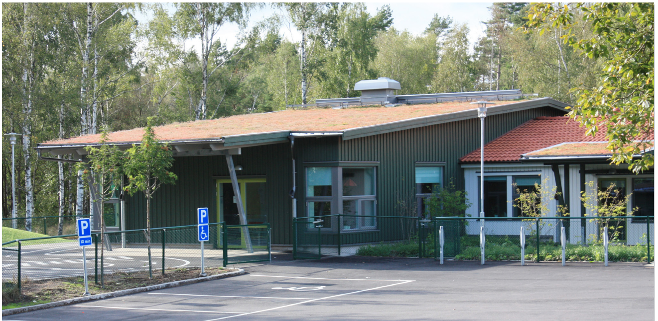
TVÅ NYA AVDELNINGAR RYMS I DEN TLLBYGGDA DELEN AV FÖRSKOLAN

Bräcke förskola är byggd i början av 1970-talet. Den ligger i natursköna omgivningar i Kode norr om Kungälv. Större barnkullar och inflyttning skapade behov av att bygga ut förskolan. Det fanns också problem med dålig luftkvalité och fukt i syllén. Nu har ABAKO ritat en helt ny tillbyggnad till förskolan vilken