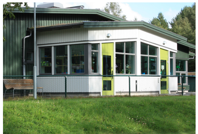
ENTRÉ I NYBYGGNADEN

OBJEKT: Bräcke förskola, Kungälv ARKITEKT: ABAKO Arkitektkontor AB BYGGHERRE: Kungälv kommun BRUTTOAREA: Ombyggnad 850 kvm, tillbyggnad 310 kvm BYGGÅR: 2014